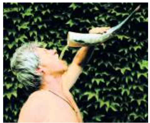
Stielecht: Met trinkender Kelte

Achim Werner: Keltische Kochbarkeiten. Theiss Verlag, Stuttgart. 96 Seiten, 12,95 Euro.