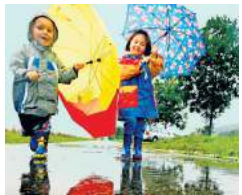
„Pitsch, patsch – woher kommt das Nass?“, fragen Kinder.

Gerade Erstaunen im Familienkreis ausgelöst. Das Buch „Mit Kindern das Wetter entdecken“ gelesen, anschließend beim nächsten starken Hagelanschlag vor den Fenstern einfach und verständlich erklären können, wie diese Eiskörnchen entstehen und warum. Da hörten dann sogar Siebzehnjährige noch mit zu. Auf diese oder ähnliche Weise wäre Bernd Fleissners kleine meteorologische Grund-